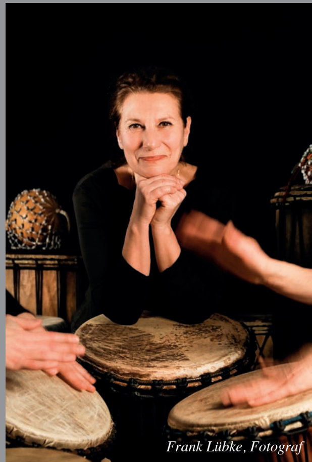
Frank Lübke, Fotograf

Ein herzliches DANKE an ALLE, die diesen Weg mit mir gegangen sind, und weitergehen...!